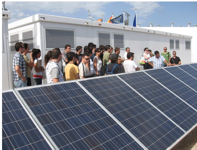
Visita a planta fotovoltaica dentro del curso “Energía solar térmica y fotovoltaica: fuentes renovables de energía”

La edición 2008 contó con la presencia de 350 profesores de reconocido prestigio nacional e internacional en sus respectivas áreas de actuación; 140 de ellos (el 40%) procedentes de otras provincias españolas, mientras que 166 (el 47%) proceden de distintos ámbitos profesionales (no académicos).