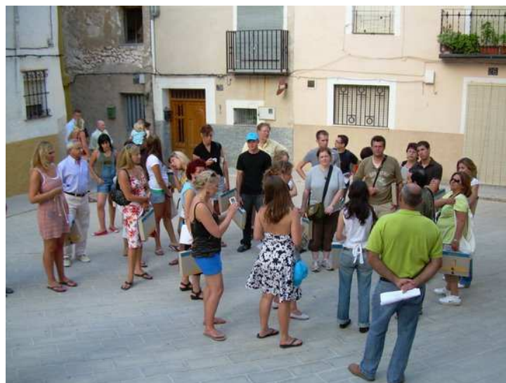
Visita cultural a la villa de Cocentaina

Dentro de la propia dinámica de los cursos, se combinan las clases magistrales con salidas de campo y actividades culturales como conciertos y visitas a exposiciones. Además, las actividades culturales que se organizan en las distintas sedes de la Universidad (Biar, Villena, Cocentaina, La Nucía, etc.) son el complemento ideal de nuestros cursos, permitiendo al alumnado conocer otras zonas de nuestra provincia.